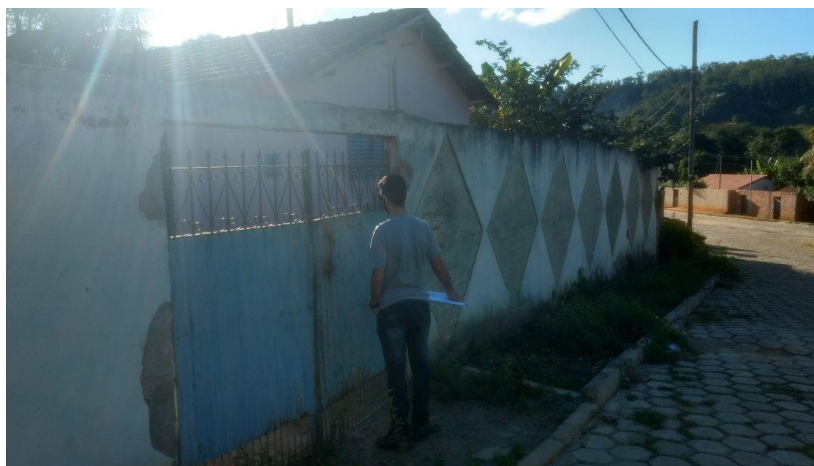
Figura 1. Registro fotográfico da visita.

No dia 08/06/2017, equipe técnica da empresa Synergia, enviou SMS para os números declarados pelo manifestante, com o objetivo que a família entre em contato com a empresa para realização do Cadastro Integrado.